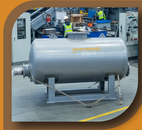
غلاية تسخين الايثانول