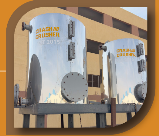
تنكات استخراج الذهب